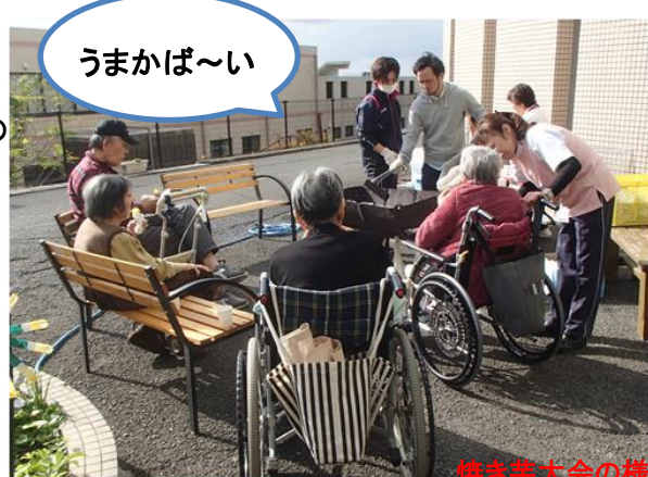
焼き芋大会の様子