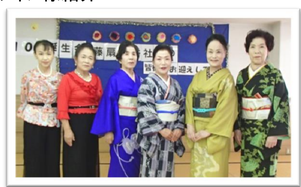
10月 藤扇南秀社中様