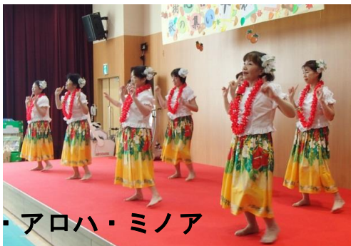
ピリ・アロハ・ミノア